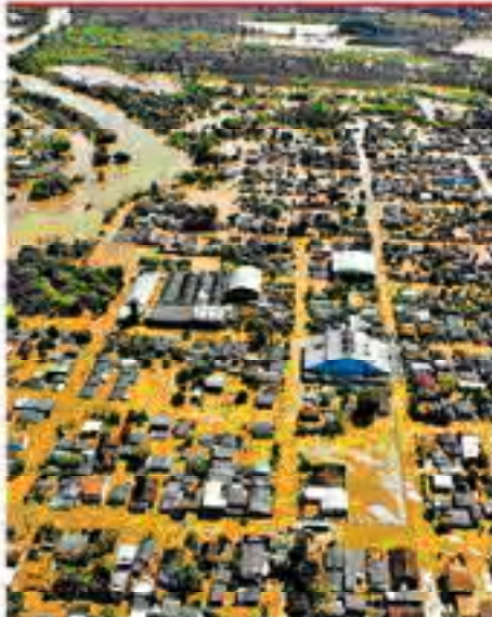
ENCERTE Mas Interpol não vai... São Paulo, 25 de setembro de 2007. Uma vista aérea de uma favela em São Paulo, com casas amarelas e ruas estreitas. Pág. 49